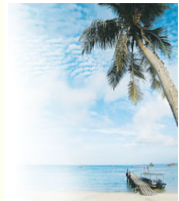
純樸的浪中島，海水清澈，沙灘潔白柔軟，處處如詩畫般令人陶醉。