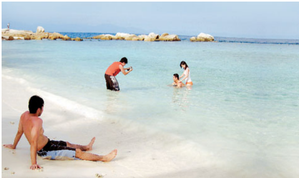
年輕男女喜歡在海灘散步或嬉水，當然不忘拍照留念。