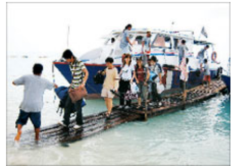
旅客乘汽艇抵達浪中島，必須捲起褲管涉水登岸。

將行李擱放一旁，休息並用過午餐后，我再度登上汽艇，到島嶼的另一端浮潛。儘管不會游泳，但我還是決定戴上眼罩及呼吸管配備，工作人員在旁牽引，體驗了浮潛的樂趣，看看繽紛的珊瑚礁，而許多不知名的魚兒都湊過來打招呼呢！