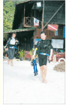
一些愛浮潛的遊客，甚至還下了訂單，安排重回浪中島考取潛水執照。